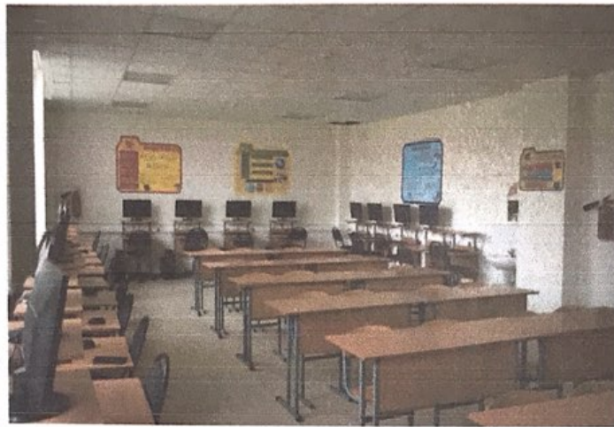
Комплексная учебно-лабораторно-производственная база учебных классов отделения «Защита в чрезвычайных ситуациях».